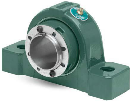
ABB tar driftsäkerheten till ny nivå, med lanseringen av Dodge / Baldors innovativa lagerserie ISN, för extrema miljöer som t.ex; betonganläggningar, sten bearbetning, grustag, gruvor, järn-, & stålbearbetning